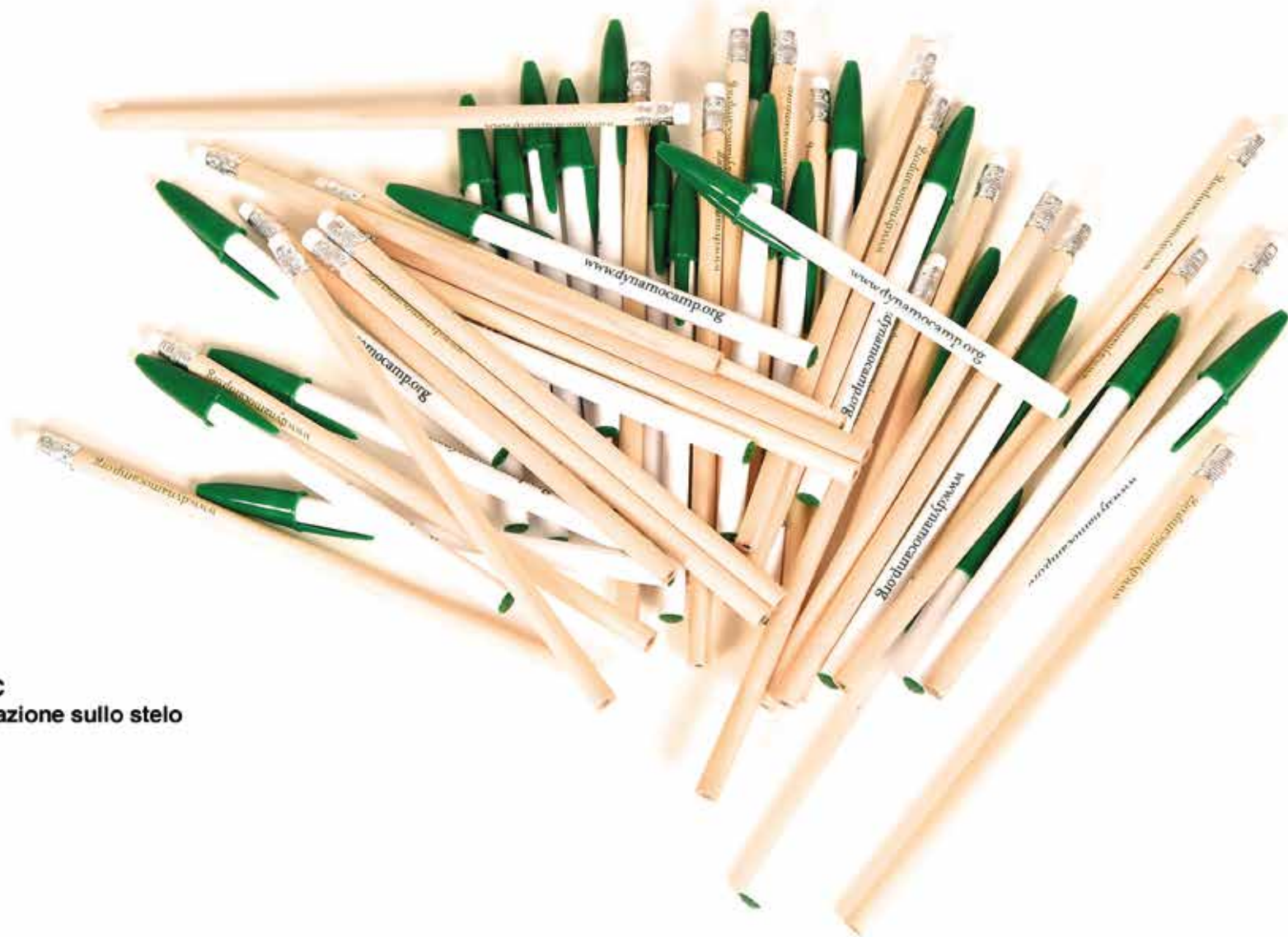
MATITE E BIC - Personalizzazione sullo stelo