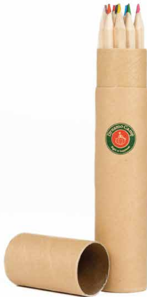
MATITE IN ASTUCCIO - Personalizzazione sul packaging di cartone