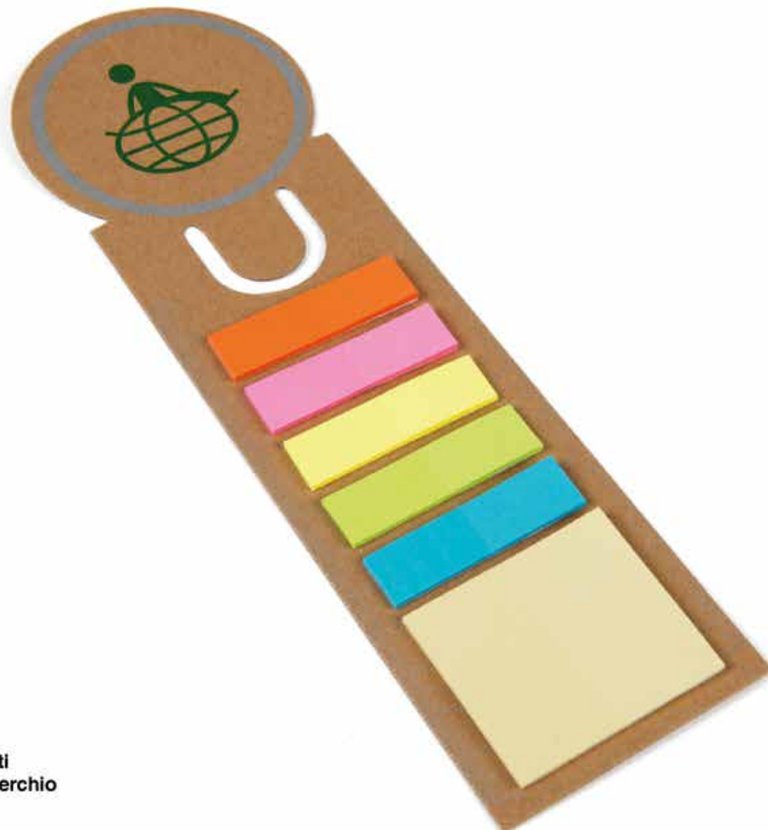
SEGNA LIBRO POST-IT - Funzione righello sui lati - Personalizzazione nel cerchio